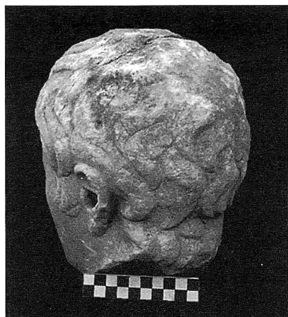
Fig. 4 Marble head of Heracles.