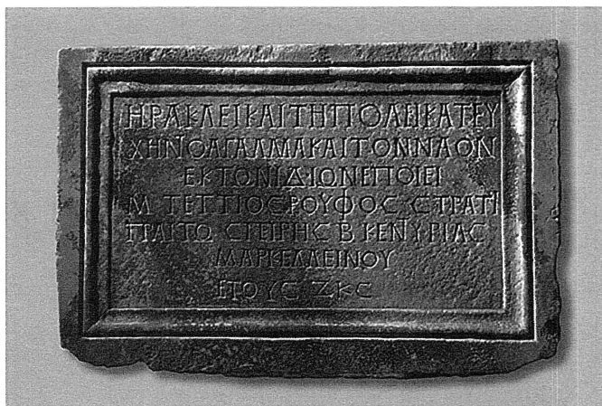
Fig. 5 Exvoto inscription of M. TetiosRufos.

After Goths' invasion in 267/68, when the town was devastated, the temple had been repaired. But, very soon, its main role was changed and the building began to be used for common needs of the citizens in dangerous and not peaceful times.