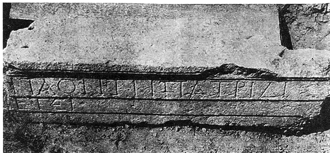
fig. 2a (see the picture above) and fig. 2b (see the picture below) Inscription on architrave.

precisely framed, contains fine engraved inscription with very important information as follows: